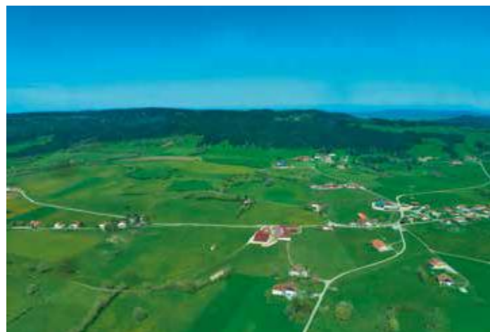
Hameau agricole de Grand-Chaux à Guyans-Vennes